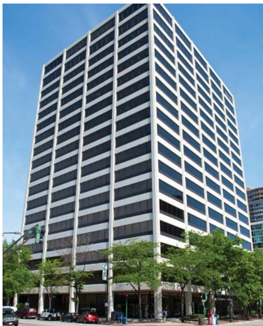
One Rotary Center din Evanston, Illinois, SUA

Rotary International este condus de un secretariat compus din secretarul general și aproape 800 de angajați care lucrează pentru a sprijini cluburile și districtele din întreaga lume. Sediul central al Rotary se află în Evanston, Illinois, SUA, într-o clădire denumită One Rotary Center. Include un amfiteatru cu 190 de locuri, arhiva Rotary și un spațiu destinat conducerii, cu săli de conferință, pentru consiliul de administrație RI și administratorii Fundației Rotary, și birourile