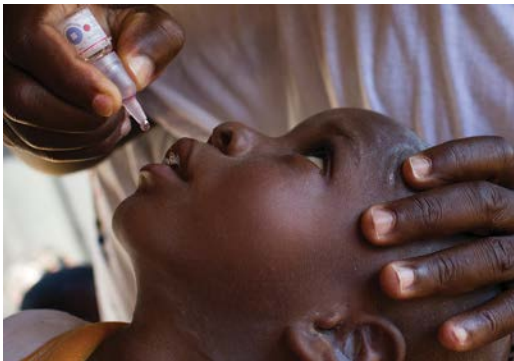
Rotarian administrând un vaccinul antipolio în Nigeria, Africa

Contribuțiile la fundație ale membrilor noștri și ale altor persoane ne permit să schimbăm în mod sustenabil comunitățile aflate în nevoie. Întrebați președintele comitetului pentru Fundația Rotary sau vizitați rotary.org/donate pentru a afla cum puteți să sprijiniți fundația noastră. Pentru a afla mai multe, descărcați The Rotary Foundation Reference Guide (Ghidul de referință privind Fundația Rotary) sau parcurgeți cursul Rotary Foundation Basics (Informații esențiale despre Fundația Rotary) pe pagina Learning Center (Centrul de învățare) a Rotary.