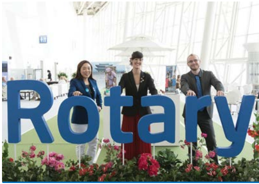
Participanți la convenția internațională Rotary 2016, Coreea